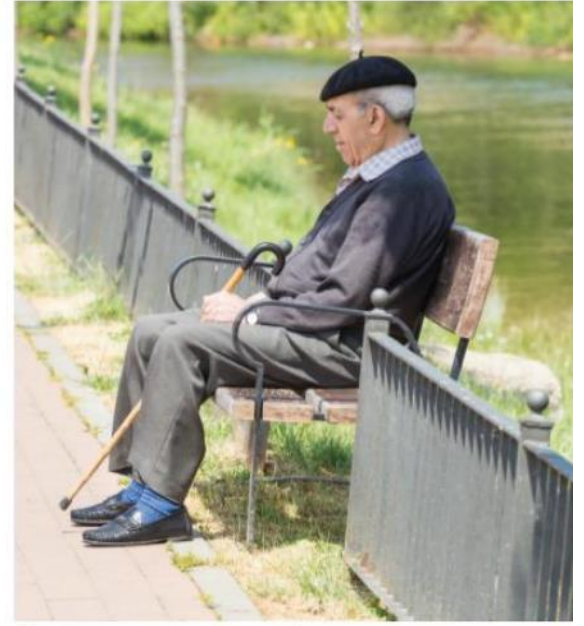
De paseo y echando una siesta

Lo más curioso para el observador acostumbrado a un horario europeo 'normal' es que la final de la versión española de 'MasterChef' termine a las 00:45. Este horario explica, en parte, por qué se decía de España que era 'un buen país para vivir pero no para trabajar'. Pero antes de aceptar este nuevo horario, será importante decidir si lo que era 'diferente' del país tenía un valor que vale la pena conservar.